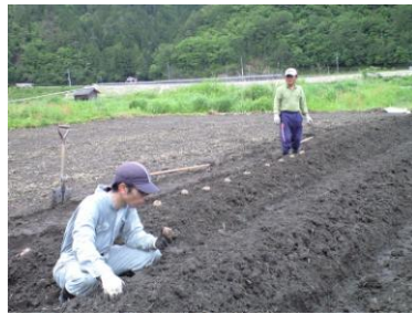
▲手作りの高畝に植えました

の畑に入れると一挙両得なので は。今年が良いこんにやく芋が 収穫できるように頑張ってみま しょう。畑の状況は、随時お知 らせしますのでお楽しみに。