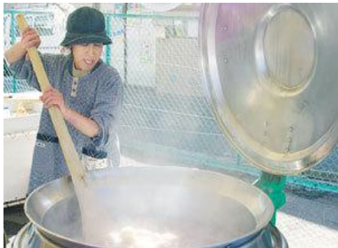
湯気とともにおいが立ち上った手作りこんにやく

【佐伯区】コイン通り歳末特別「五日の市」が5日、広島市佐伯区のコイン通り一帯であった。今春から「五日の市」ののぼりを立てた商店で毎月5日実施している特別売り出しの年末感謝版で、今回はイズミ五日市店の駐車場にも会場を設置。フリーマーケットや浜田の海鮮市、スタンプラリーなど楽しみを追加し、多くの来場者にぎわった。